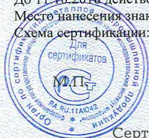
Схема сертификации: 5.

Руководитель органа (заместитель руководителя)